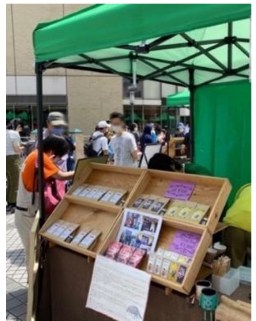
※テントと木箱の設置イメージ