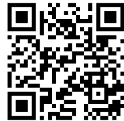
申込フォームQRコード