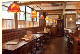
文: 伊川ありさ (まちづくり府中インターン・武蔵野美術大学学生)