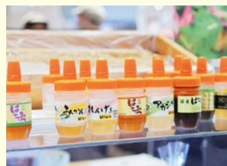
文: 堀詩 (東京外国語大学学生)