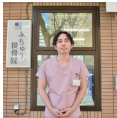
念願の府中けやき並木通り沿いに開院

中学校の野球部を訪問して「スーパーアスリート育成教室」の講師を務めました。他にも、赤ちゃんがいるお母さん向けの講座も開催して、産後ケアや赤ちゃんに起きがちなケガ、例えば手をひっぱって肘がぬけてしまった時の対応など、お母さんも赤ちゃんも元気でいられる内容にしています。毎年参加している「まちゼミ」は小学校でチラシが配布されるので、40代の子育て世代の参加が多く、普段あまり接点のない方との新たな出会いにつながっています。「まちゼミ」を通して他の店舗さんとの交流もあって、知り合いが増えました！