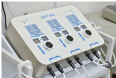
最新のEMS機器も導入

姉弟で通院していた高齢の患者さんのことはよく覚えています。予約日の前日にお二人で散歩されている時にお会いしたんですが、翌日、弟さんが予約時間になってもらっちゃらなくて。真面目な方だったので変だな…とっていたら、お姉さんが亡くなったと連絡が入りました。昨日会った方が、今日亡くなってしまったという事実が受け止められず、複雑な気持ちになりました。健康になってもらう仕事に就きながら、健康にできない部分や、見えない部分はどうしても出てきてしまう。人間の身体ってとても不思議ですよね。でも、だからこそ、ひとつでも喜んでもらえることをしたいと思っています。これは、治療という側面だけでは難しいと感じているので、患者さんとの会話を大事にしています。