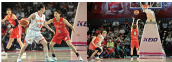
昨シーズンプレーオフファイナルの様子