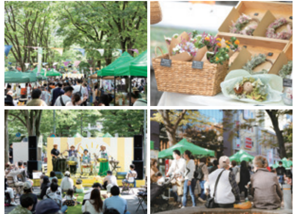
これまでのキテキテ府中マルシェの様子